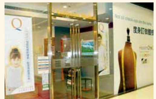
荃灣“確進醫療中心”的入口，就在舊地址的斜對面

“確進醫療中心”除提供公司指定的驗身項目外，更以優惠價錢為同事提供額外自費的驗身項目，如有需要，可向人力資源部查詢。