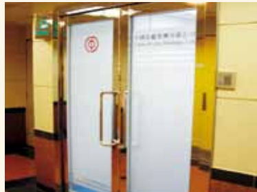
荃灣中國染廠 25 樓的辦事處入口

中國染廠部份部門已於 2010 年 12 月 6 日分別遷入荃灣中染大廈 25 樓 B 室及 26 樓辦事處。在集團的支持、配合及眾同事們同心協力下，搬遷順利於 2 天內完成。入伙日早上，我們邀請到阮壽庸先生為我們主持入伙儀式、致賀詞及切燒豬慶祝。祝願中國染廠遷入新址繼續大展鴻圖、生意興隆。