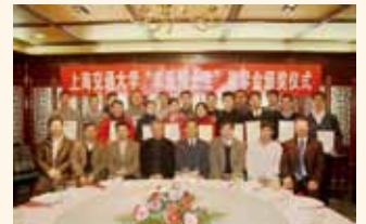
頒獎嘉賓與各獲獎學子合照