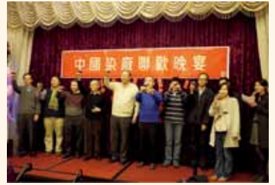
各位領導人在台上祝酒