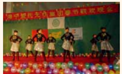
綜企 8 位姑娘的精彩表演

聯歡會在領導們熱情洋溢的新春致辭中拉開了帷幕。隨後一個又一個表演節目，節目都是各廠員工利用自己的業餘時間自編自排的啊：綜企的 8 位姑娘帶來的開場舞《歡樂恰恰》迅速點燃了晚會的熱情；新高的吉他小夥彈唱一曲《真的愛你》，聽得大家如癡如醉；新能的“翀鋒組合”帶來的《奔跑》非常吸引；綜企的小品《相親》和《推銷》，讓人捧腹之餘，不禁回味和思考小品所反映的社會現象；新高的群舞《玩轉 2010》再次把晚會推向高潮。晚會還有別開生面的抽獎活動助興，最後在一片歡聲笑語中圓滿結束。